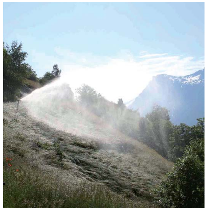
Bild 3. Bewässerung von Bergwiesen in Eggen (VS) (Quelle: Stefan Lauber, WSL).

zu vermeiden oder zu vermindern. Da die trockenheitssensitiven Handlungsbereiche (z.B. Landwirtschaft, Forstwirtschaft, Schifffahrt, Wasserwirtschaft) bereits seit Jahrhunderten immer wieder mit Trockenperioden zu kämpfen haben, haben sich eine Reihe von Anpassungsmassnahmen etabliert, die, wenn sie frühzeitig eingesetzt werden, Schäden vorbeugen oder mindern können. Zum Beispiel werden in der Landwirtschaft insbesondere im Obst- und Gemüseanbau in Perioden mit geringem Niederschlag in einigen Regionen bereits heute Bewässerungssysteme genutzt (vgl. Bild 3); Fische werden ausgefischt und umgesetzt, wenn abzusehen ist, dass ein Flusslauf trocken fallen wird; die Personenschifffahrt greift in Phasen mit zu geringen Wasserständen auf Transportalternativen zurück. Die Massnahmen sind in den verschiedenen Sektoren unterschiedlich aufwendig und wirksam.