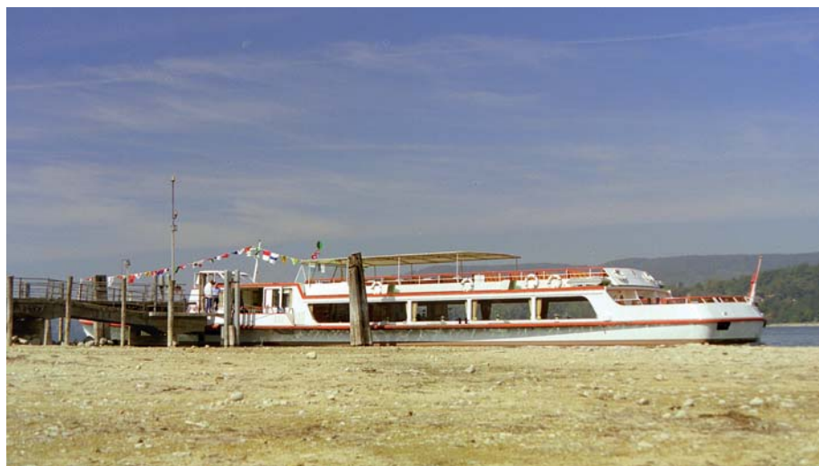
Bild 1. Die Schifflände in Mammern (TG) im Sommer 2003 (Quelle: Lukas Reimann, URh).

Ob Trockenperioden in den Sektoren, die auf die Verfügbarkeit von Wasser angewiesen sind, zu Problemen und Schäden führen, hängt einerseits von der Intensität und Dauer der Trockenperioden ab. Andererseits wird die Verwundbarkeit eines Sektors durch die bestehenden Möglichkeiten bestimmt, vorsorgend Gegenmassnahmen zu ergreifen und so Schäden